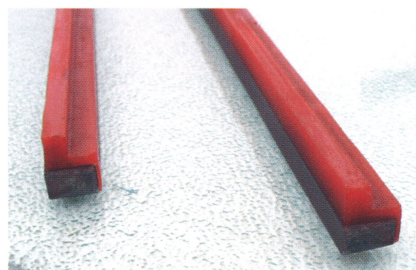
raschietti in P.U. per carrelli presse